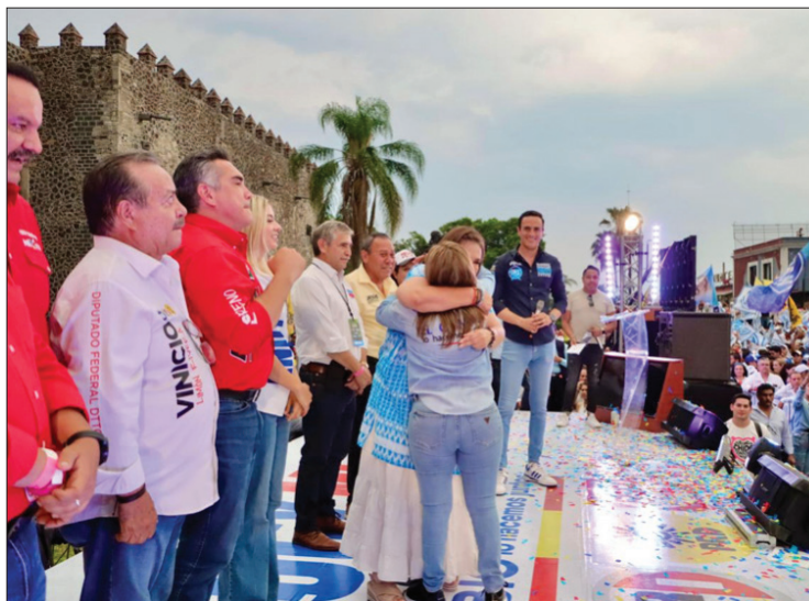
▲ Frente a Palacio de Cortés ondeaban las banderas de los partidos coaligados, y un coro de cientos de voces de militantes y simpatizantes.