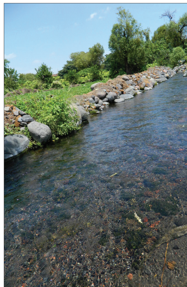
▲ Un afluente del Río Cuautla.

Sin embargo, siempre conocer más a fondo la situación, actualizar datos y difundir los resultados puede generar conciencia entre los pobladores que son quienes disfrutan el territorio y deben ayudar también a cuidar su entorno natural, juntamente con políticas públicas necesarias que garanticen la protección de los ecosistemas. En la próxima nota abordaremos precisamente cuáles deberían ser estas políticas.