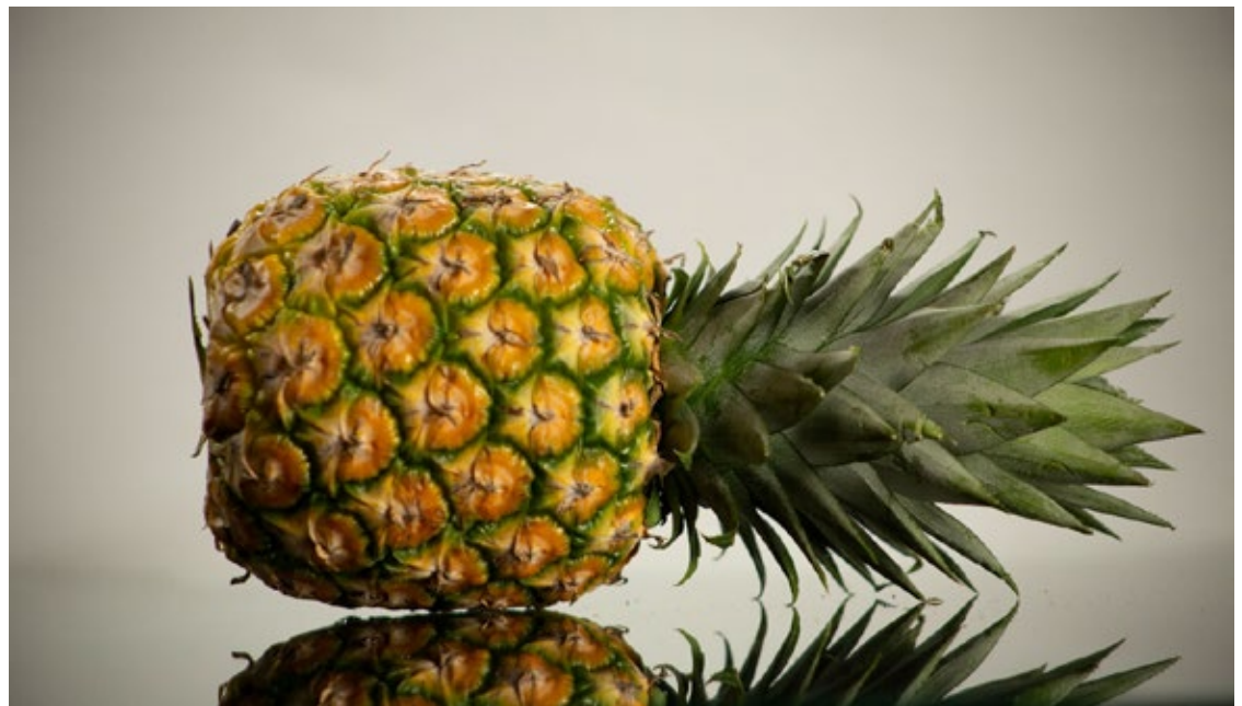
▲ Las frutas melón, piña y sandía son una buena opción de temporada por su costo accesible y alta disponibilidad.

Este fruto posee un alto contenido de agua y electrolitos, como potasio, para reponer líquidos y minerales perdidos durante las actividades cotidianas y deportivas. Además, esta fruta provee de vitamina A, esencial para la salud de la visión, la piel y el sistema inmunológico, y tiene un bajo porcentaje calórico bajo.