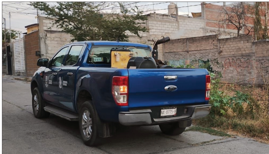
▲ En Temixco continúa la fumigación como medida de prevención y combate de enfermedades transmitidas por vectores como el Dengue, Zika y Chikungunya.