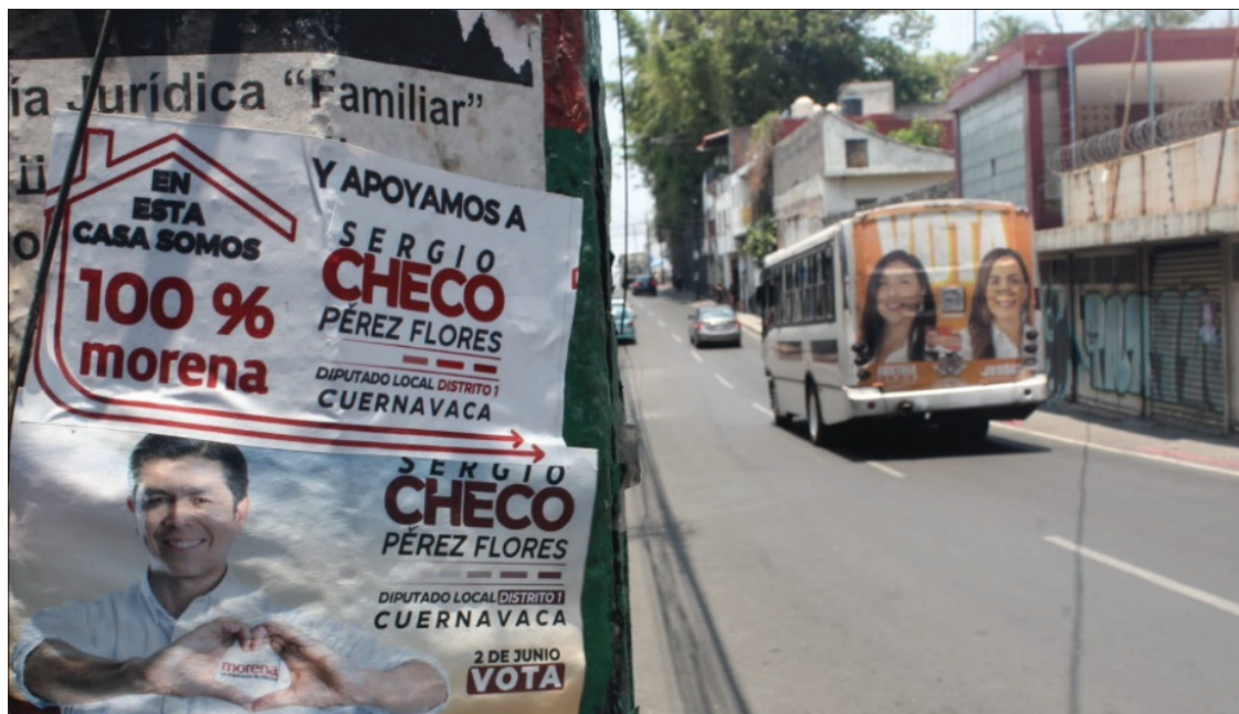
▲ Piedefoto.