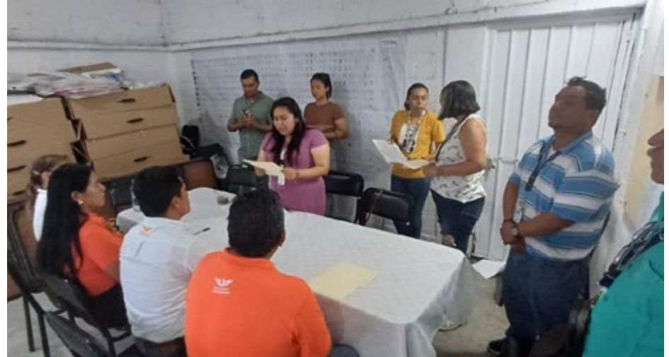
▲ Axochiapan.