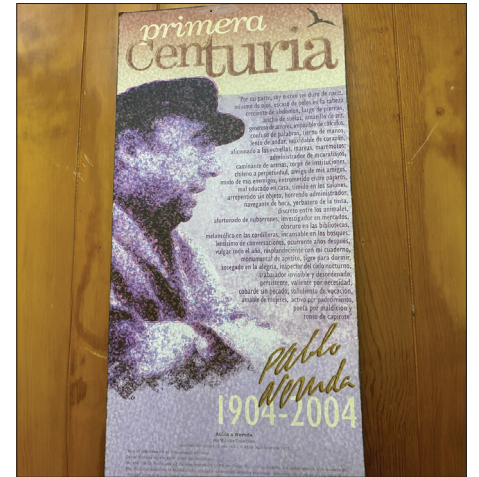
▲ Imagen cortesía del autor.

Él venía con un amigo con el que conversamos durante todo el viaje, el cual se hizo corto no solo por lo ameno de la plática, sino también porque a Mauricio le gusta manejar con precaución pero a altas velocidades, y eso me ponía un poco nervioso. (Debo confesar que yo traía a cuestas los efectos de