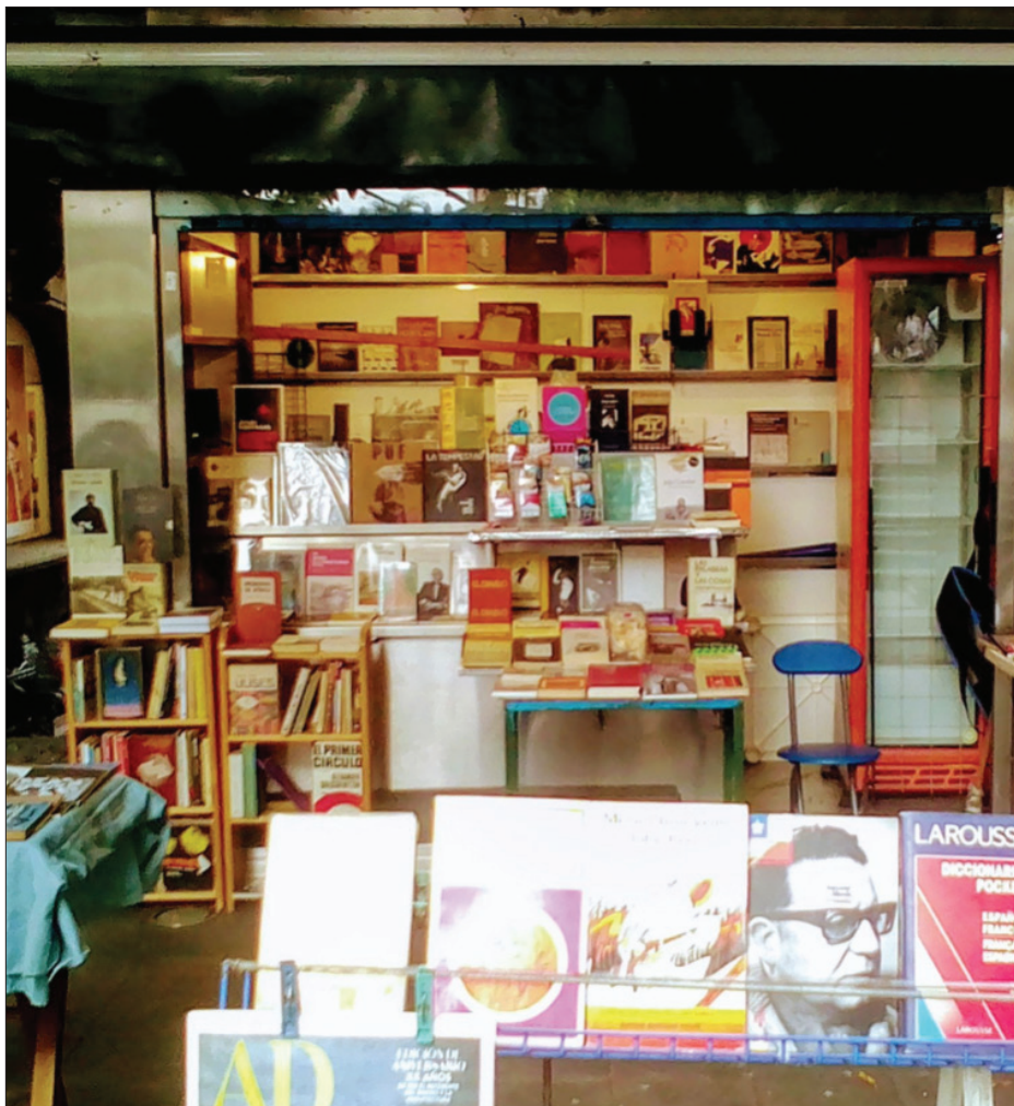
▲ La innumerable librería. Pasaje de Correos, Cuernavaca Centro.