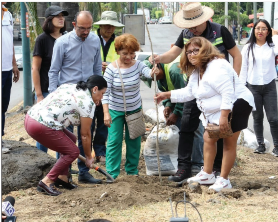
▲ En esta edición de la Jornada de Reforestación Urbana se plantaron 41 especies incluidas en el Manual para el Arbolado de Cuernavaca, catálogo creado por la presente administración municipal.

El Manual para el Arbolado de Cuernavaca se puede consultar en la página oficial del Municipio de Cuernavaca https://cuernavaca.gob.mx/ reiterando la Secretaría de Desarrollo Sustentable y Servicios Públicos su apoyo para atender cualquier petición de plantación; además de puedes adquirir en donación distintos tipos de árboles con la finalidad de mejorar las condiciones ambientales de la ciudad.