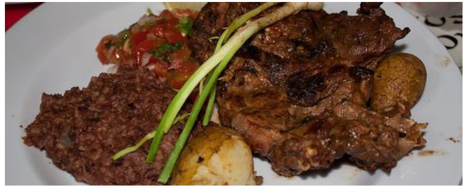
▲ Tepezcuintle.