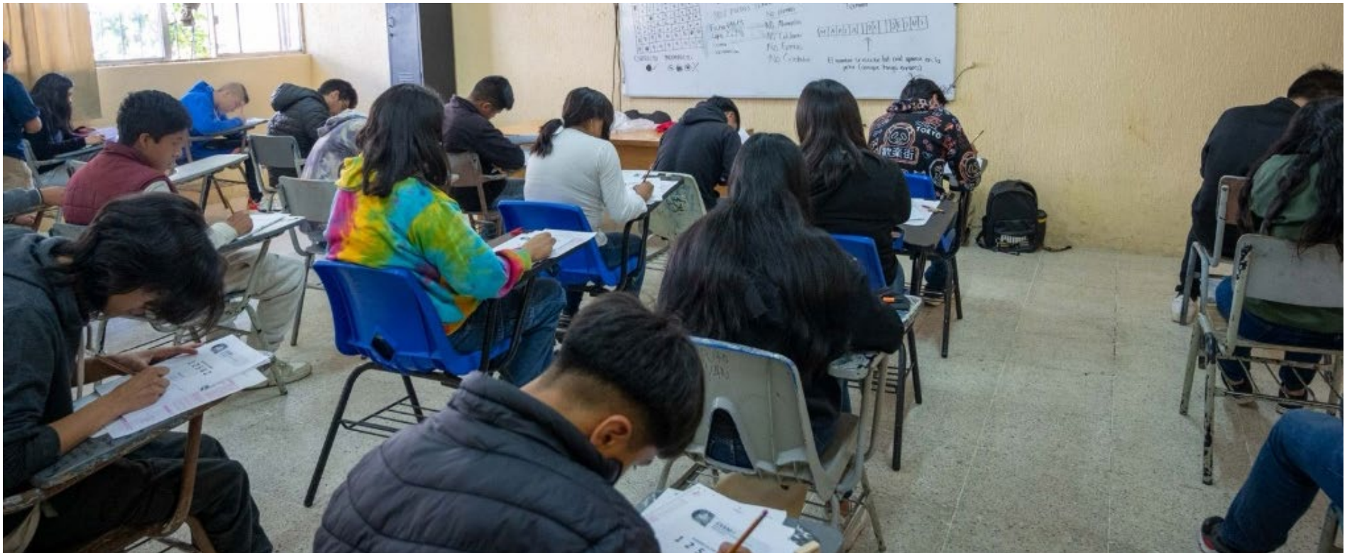
▲ Los 4 mil 642 aspirantes a ingresar a las preparatorias de la UAEM tuvieron hasta cuatro horas y media para completar su examen de admisión.