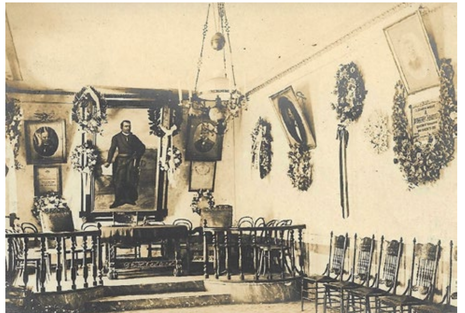
▲ Sala capitular de Cautla y retrato de José María Morelos y Pavón, ca. 1910.

Entre el 15 de junio de 1874 y el 5 de enero de 1876, Cautla, la Heroica Ciudad de