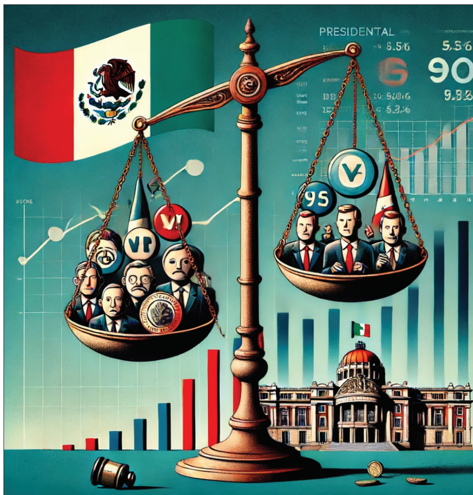
▲ Imagen: elaborada con Inteligencia Artificial / cortesía del autor