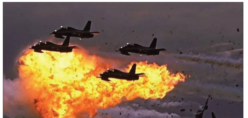
▲ Imagen: Corbis Images

*cafetera por devoción, poeta por sobrevivencia, feminista de tiempo completo.