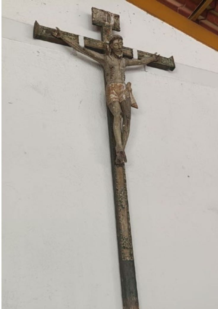
▲ La figura más antigua que resguarda San Esteban es el “Cristo Jesús Crucificado”, de la que solo tienen conocimiento que fue de las primeras que tuvo el templo franciscano que a mediados de este siglo cumple 500 años de haberse construido.

Imágenes talladas hace cientos de años, una de ellas se presume que tiene más de 400, serán restauradas con una inversión superior a los 500 mil pesos en el Templo de San Esteban de la comunidad autóctona de Tetelpa, de este municipio, anunciaron dos comités que participan en la recaudación de los recursos.