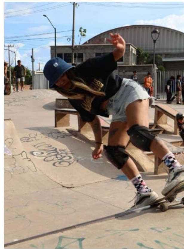
Redacción ▲ Fotos: Ayuntamiento de Jiutepec.