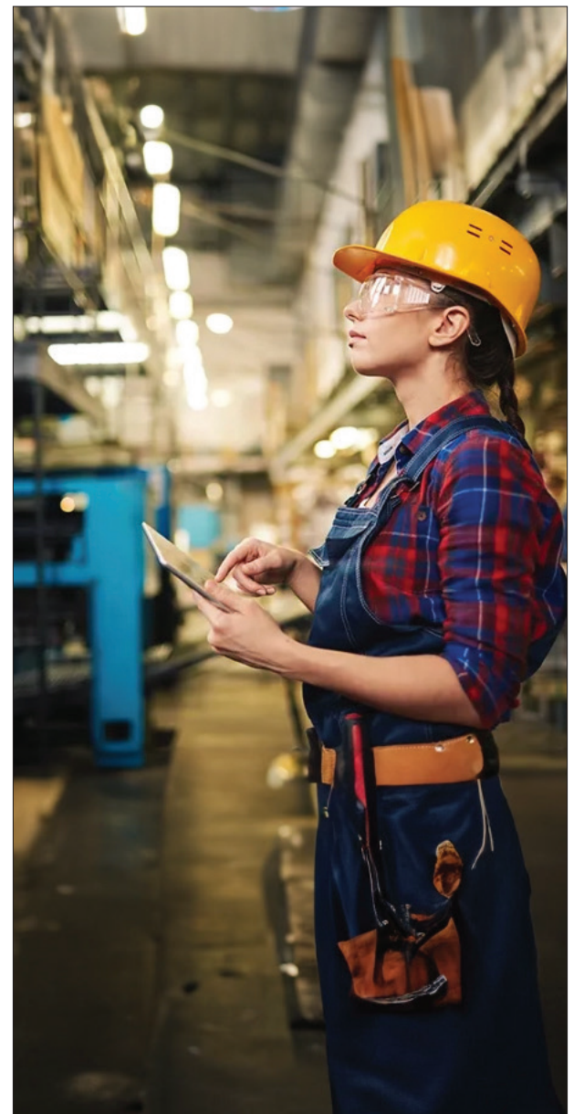
▲ Imagen: Cortesía el autor.

*Colaboradora del NODESS Morelos Solidario y Cooperativo. Estudiante del Doctorado en Derecho y Globalización de la Universidad Autónoma del Estado de Morelos