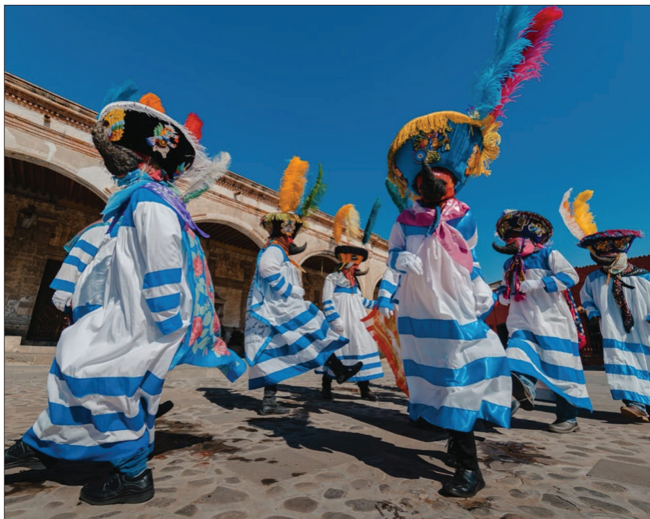
▲ En San Antonio, Texas, se promoverá la riqueza cultural y turística de Tepoztlán, Tlayacapan, Xochitepec y Tlaltizapán.

A la tercera edición del Tianguis asisten ocho grandes asociaciones del sector a nivel nacional e internacional, cuyas empresas agremiadas llevan productos turísticos de Pueblos, Barrios Mágicos y del segmento inclusivo, como la Asociación Mexicana de Agencias de Viajes (AMAV), Asociación Metropolitana de Agencias de Viajes (La Metro), Consejo Nacional de Exportadores de Servicios Turísticos (Conexstur), Asociación Mexicana de Turismo de Aventura y Ecoturismo (AMTAVE) y CCRA Travel Commerce Network, que representa al mayor número de agentes de viajes de los Estados Unidos.