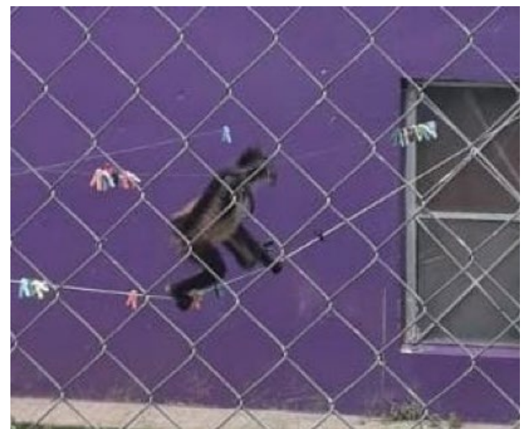
▲ Los bomberos rescataron al ejemplar y lo entregaron al propietario quien cuenta con permiso de la Secretaría de Medio Ambiente y Recursos Naturales.

Los bomberos capturaron al ejemplar y lo entregaron al propietario que, según el registro de la Secretaría de Medio Ambiente y Recursos Naturales, tiene una superficie de 0.21 hectáreas donde puede criar loro amapola, cotorra cucha, cotorra frente banda, guacamaya azul dorado, loro alas naranjas, guacamaya verde, perico atolero, loro cabeza negra, loro gris africano, perico de collar, perico cabeza gris, loro tehuano, loro de nuca amarilla, electus de lados rojos, loro rojo, las conuro nanday, guacamaya enana, cotorra montañesa, agarponis cabeza negra, perico pico duro, cacatúa galah, y mono araña.