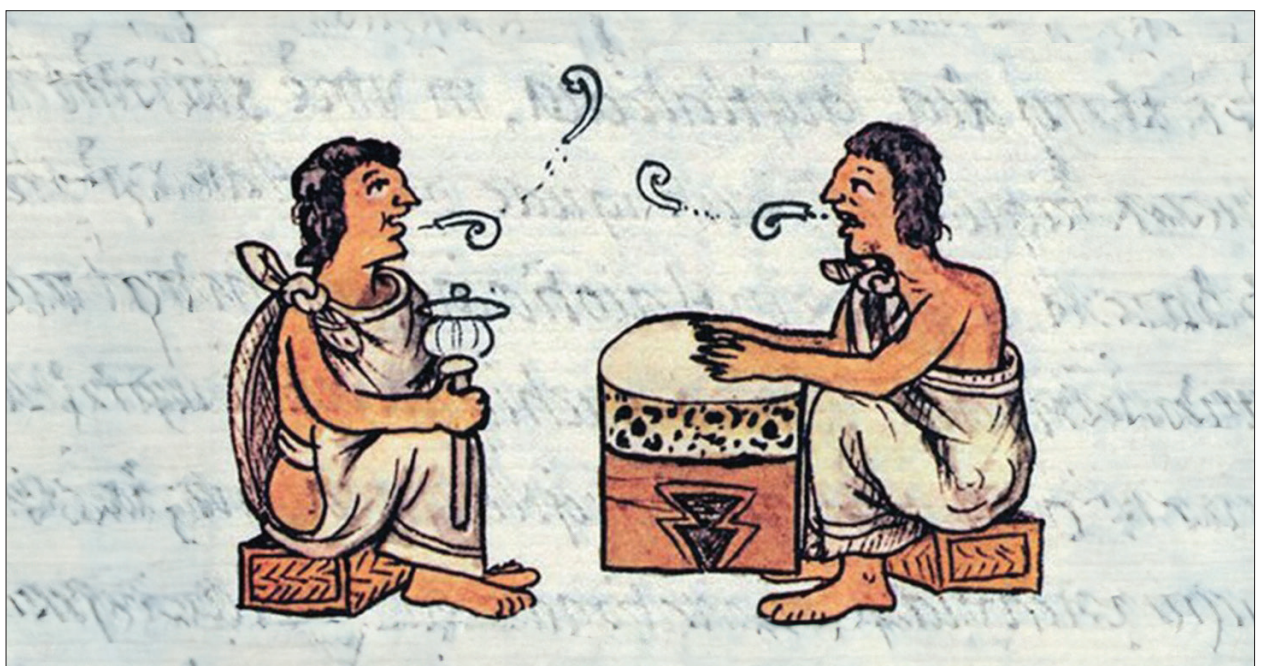
▲ Ilustración del Códice Florentino, de finales del siglo XVI.