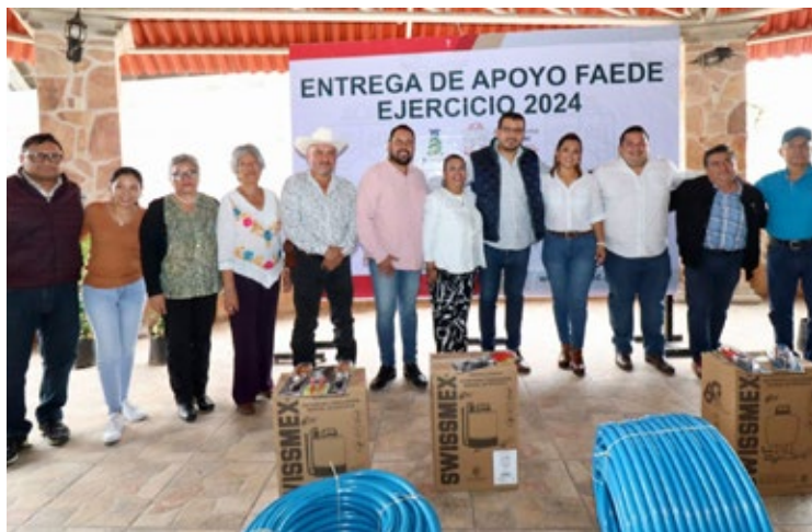
▲ A lo largo de seis años (2019-2024) la administración municipal ha respaldado con apoyos en especie, a mil 145 viveristas jiutepequenses con una inversión de cuatro millones 136 mil 362 pesos del Fondo de Aportaciones Estatales para el Desarrollo Económico (FAEDE).