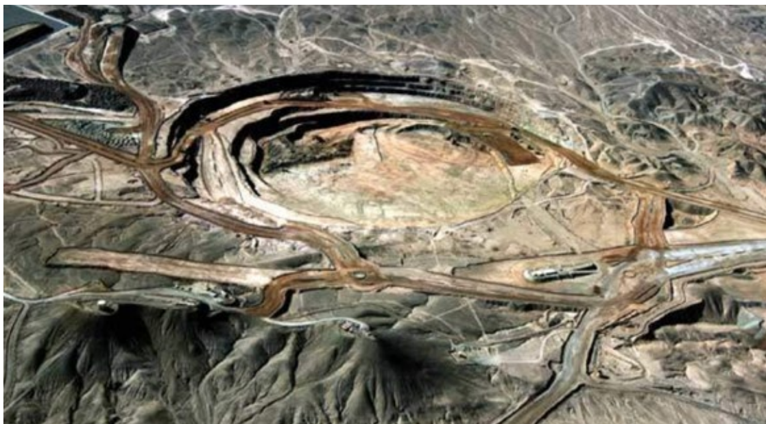
▲ Proyecto Esperanza Silver.

Por último, es fundamental que las autoridades locales y la población comprendan los efectos de la financiarización y adopten medidas preventivas para reducir sus riesgos. Es necesario implementar políticas públicas que regulen de manera adecuada el crédito y la inversión, así como proteger a los consumidores y a las comunidades más vulnerables, con el fin de evitar impactos negativos. Solo de esta manera podremos enfrentar de manera efectiva los retos y capitalizar las oportunidades que la financiarización pudiera ofrecer.