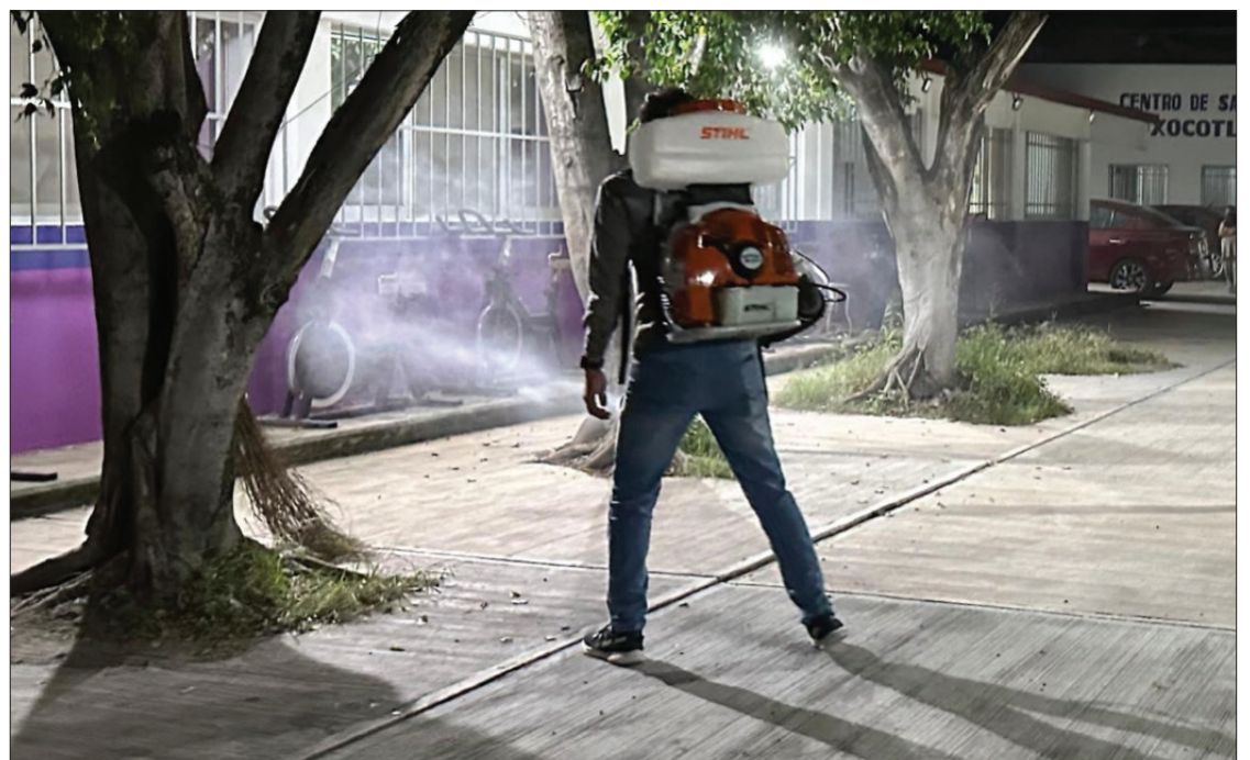
▲ Para realizar una "fumigación masiva" para combatir al vector de dengue en Xoxocotla, las tres jurisdicciones sanitarias y el municipio se unieron para realizar termonebulizaciones en julio.

La intervención del sector salud del estado y el municipio se realizaría entre la segunda y la tercera semana del mes de julio, "el municipio hace su parte con otorgar de insumos (a los elementos del sector salud), la gasolina que normalmente se da para cuatro vehículos, que normalmente se hace en cuatro días, por lo que es una inversión grande para poder hacer estas intervenciones". Se ocupan seis vehículos por día, con el equipo de las jurisdicciones sanitarias, los únicos autorizados para el manejo de los