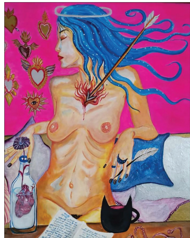
▲ Imagen: Cortesía de la autora.

Para Denisse, ver el mundo desde los ojos de la muje-