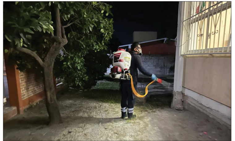
▲ Algunos municipios han reforzado ya sus medidas de protección con campañas de concientización, acciones de descacharrización y fumigaciones, pues las lluvias favorecen la proliferación del mosquito transmisor del dengue.

El 2023, el dengue repuntó en Morelos hasta alcanzar los cuatro mil 388 casos, 618% más que los 611 que se contabilizaron en el 2022. Para el 2024, la perspectiva, de acuerdo con el seguimiento epidemiológico es que los casos superarán en mucho los registrados el año anterior dado que a la fecha se superan a los del periodo anterior en más de 700.