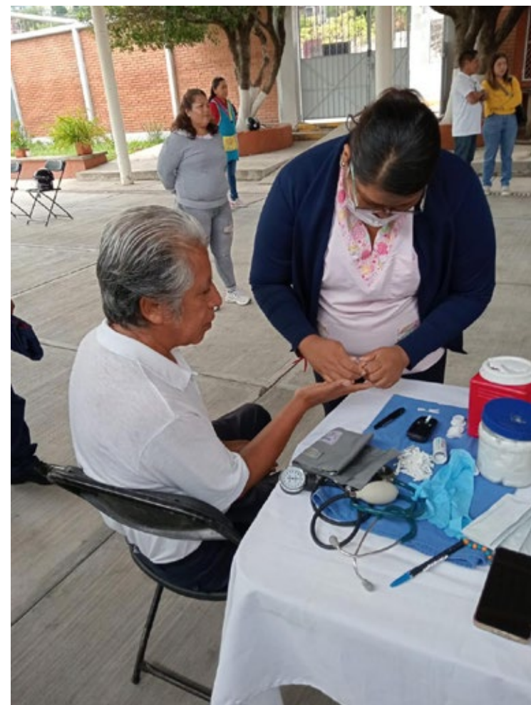
▲ En esta ocasión personal médico acudió al Jardín de Niños Rudyard Kipling de la Delegación Acatlipa para acercar servicios dentro de la 5ª Feria de la Salud en Temixco.

En el evento, se realizó la detección de enfermedades crónicas degenerativas (toma de peso y talla, pruebas de glucosa, toma de presión arterial, prueba de antígeno prostático para hombres mayores de 40 años, Esquema de Vacunación (vacuna vs la Influenza y Neumococo, Tétanos y entrega de vida suero oral), módulo de métodos anticonceptivos y prevención de adicciones, Plática sobre la importancia del ejercicio, vacunación antirrábica canina y felina, además del examen de la vista gratuito y lentes a bajo costo, entre otros servicios.