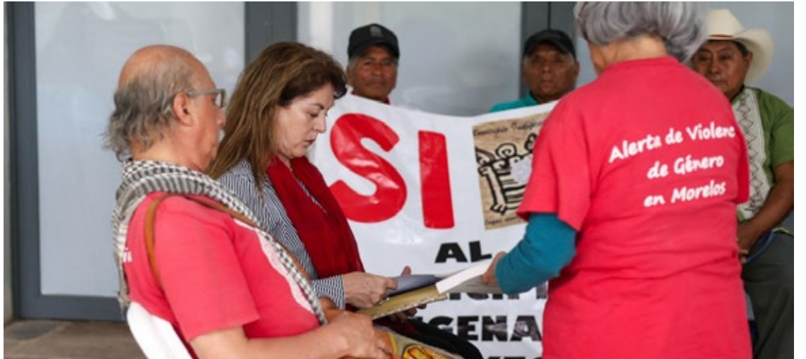
▲ La gobernadora electa señaló la importancia de reivindicar la historia de lucha por la justicia social en Morelos mediante la defensa y promoción de los Derechos Humanos, así como salvaguardar los de las mujeres.

Tras recibir los informes de Investigación sobre la Alerta de Género en Morelos que ha coordinador la CIDH, la gobernadora electa, se comprometió de darle seguimiento a los temas expuestos una vez que asuma la gubernatura del estado. Haciendo hincapié en que el nuevo gobierno de Morelos será abierto al diálogo y tendrá como prioridad la atención a los pueblos originarios, así como asegurar el bienestar de las y los morelenses.