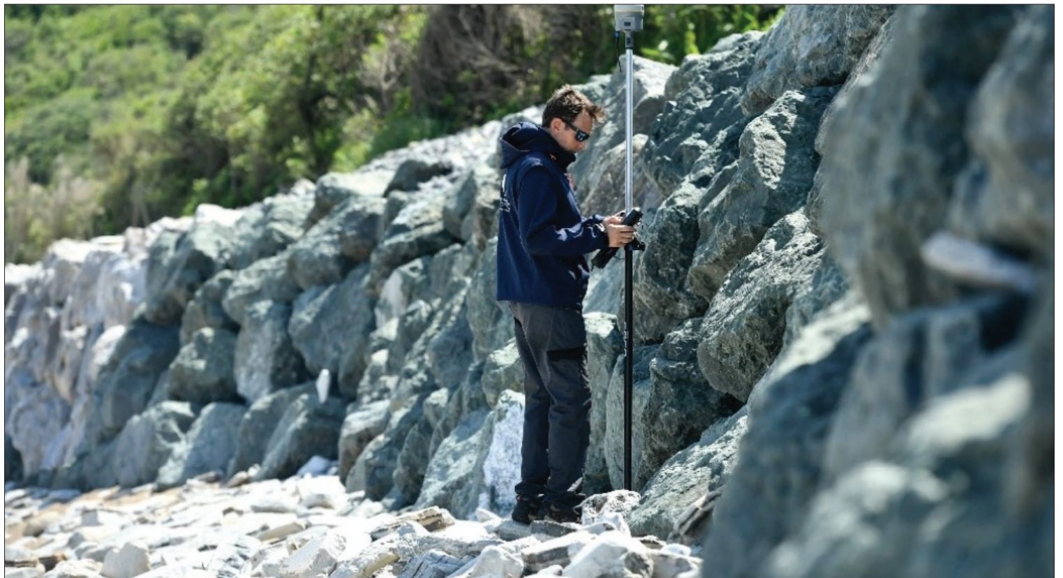
▲ Cada primavera examinan playas, dunas y arrecifes con sus instrumentos de medición: los técnicos del mapa del Observatorio de la Costa de Nueva Aquitania verifican el retroceso del litoral, que amenaza viviendas y negocios, para ayudar a definir estrategias de desarrollo.

Algunas empresas enfrentan demandas en aras del principio de “quien contamina paga” o con el fin de “cerrar el grifo” a los combustibles fósiles, oponiéndose a proyectos de extracción o a su financiación.