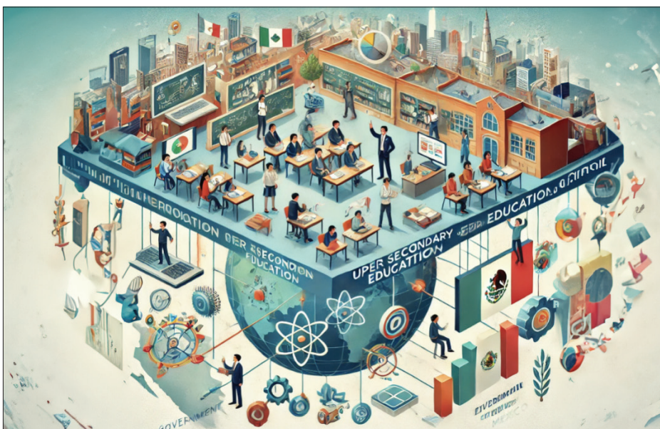
▲ Ilustración: Cortesía del autor