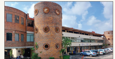
▲ El Instituto de Investigación en Ciencias Básicas y Aplicadas.

La nueva opción de nivel licenciatura que ofrece el Instituto de Investigación en Ciencias Básicas y Aplicadas, busca formar profesionales “altamente competitivos y de vanguardia, al integrar a la ingeniería, el emprendimiento y la innovación con enfoque en las ciencias de la vida, la salud y el medio ambiente, mediante la aplicación de conocimientos y habilidades, distintos enfoques teóricos y avances de la disciplina, capaces de desarrollar dispositivos, sistemas, modelos y/o procesos, contribuyendo al fortalecimiento del desarrollo científico y tecnológico, de manera multidisciplinaria, para la planeación y gestión de proyectos tecnológicos sostenibles, con ética, compromiso, empatía, iniciativa y liderazgo, así como con un amplio sentido de responsabilidad social y ambiental”.