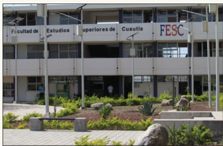
▲ La FESC ofrece la licenciatura en Administración de Organizaciones a partir de este ciclo.

La opción académica busca formar profesionales “capaces de aplicar los conocimientos con sentido crítico, reflexivo e innovador, para garantizar el funcionamiento operativo y eficiente de las organizaciones públicas, privadas y sociales, con visión estratégica, ética y compromiso social”, de acuerdo con lo que explica la UAEM.