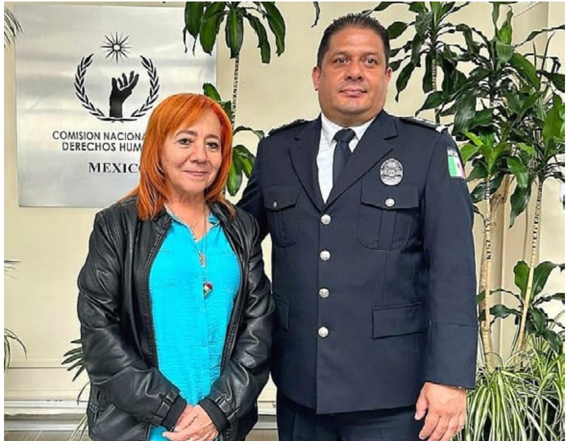
▲ La Presidenta de la CNDH, Rosario Piedra Ibarra y el coordinador de los centros penitenciarios de Morelos, Jorge Israel Ponce de León Bórquez.

cias al traslado de internos de alta peligrosidad a centros penitenciarios de alta seguridad, a las preliberaciones concedidas por el Poder Judicial del Estado de Morelos.