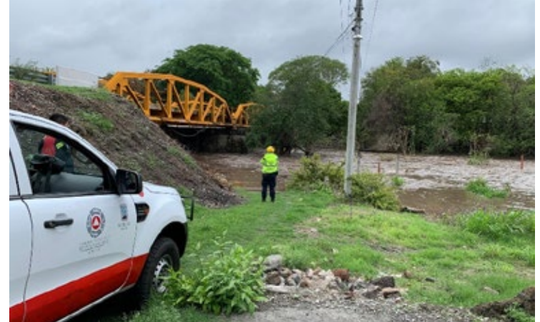
▲ Lluvias provocan inundaciones, encharcamientos y riesgo de que el río desborde su cauce.

Recordó que en el municipio se desazolvaron cuatro kilómetros de