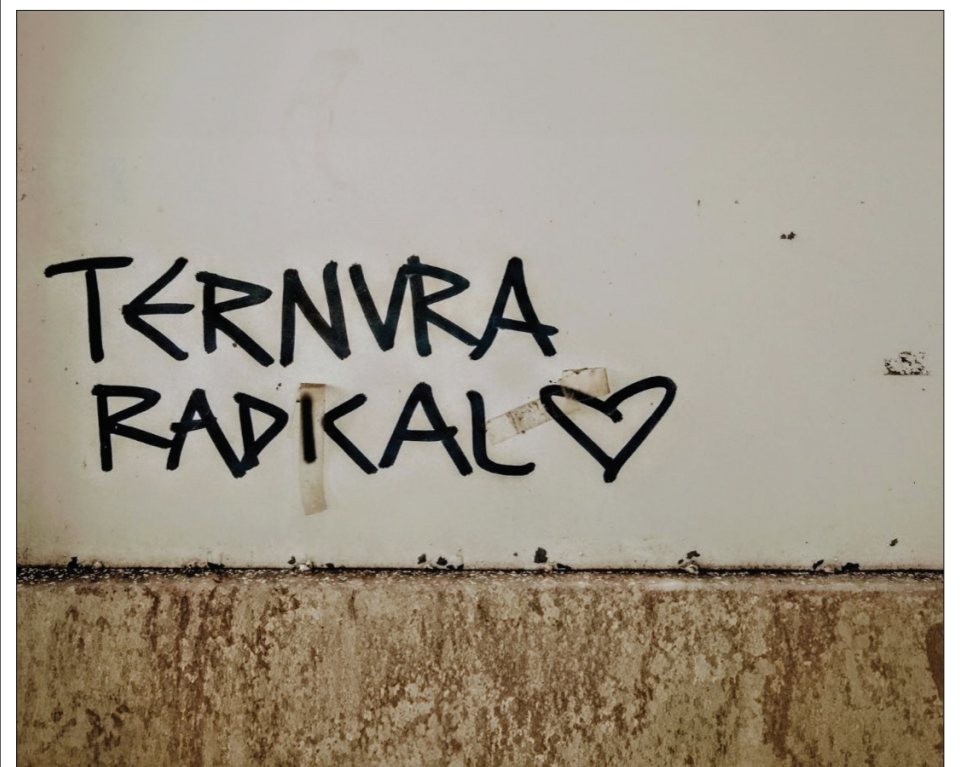
▲ Ilustración: Cortesía del autor

Así hoy quise compartir ese término que significa una oportunidad para transformar desde la ternura, los supuestos en las relaciones amorosas o filiales o de amistad, radical sí, porque frente a las violencias feminicidas no queda otra defensa que la radical, como lo ha mencionado la periodista Ana Paula VB la ternura radical es una respuesta transgresora ante el sistema que castiga la fragilidad, este término acuñado por colectivas feministas significa reconocer y abrazar cualquier sentimiento que llegue desde el interior de cada una y así poder compartirlo colectivamente en una escucha activa donde la empatía y el cariño acompañan en todo momento. La ternura radical frente a la crueldad patriarcal.