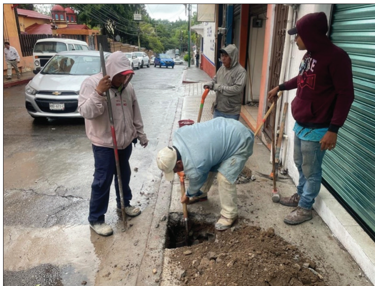
▲ Las descargas ilegales pueden afectar la red de atarjeas, señalaron las autoridades.

Los trabajos de cancelación fueron realizados por personal capacitado del departamento de construcción adscrito a la Dirección Técnica del SAPAC, siguiendo los protocolos de seguridad establecidos para este tipo de intervenciones. De esta manera, se evitó dañar la red de