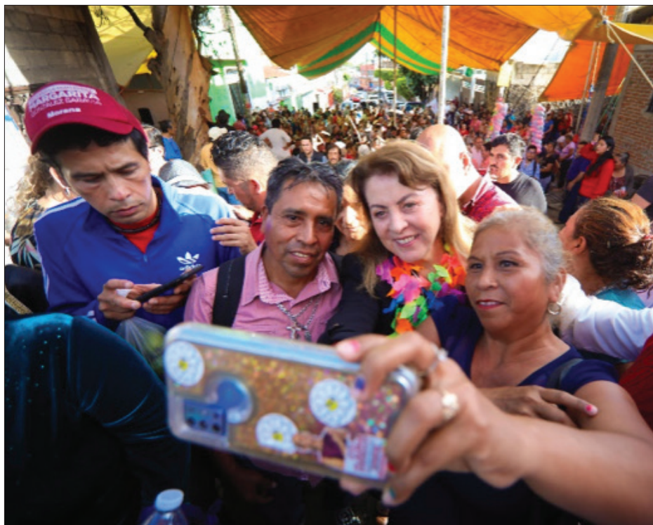
▲ Margarita González Saravia, gobernadora electa de Morelos, se reunió con vecinos de Patios de la Estación, en Cuernavaca.

Para concluir, refrendó su compromiso de ser una dirigente cercana a la gente y que tendrá un gobierno abierto al diálogo y a cada sector en Morelos; pues, dijo, no sólo reconoce las exigencias del pueblo morelense, sino que también se prepara para darles respuesta efectiva, marcando un nuevo horizonte de progreso y bienestar para el estado de Morelos.