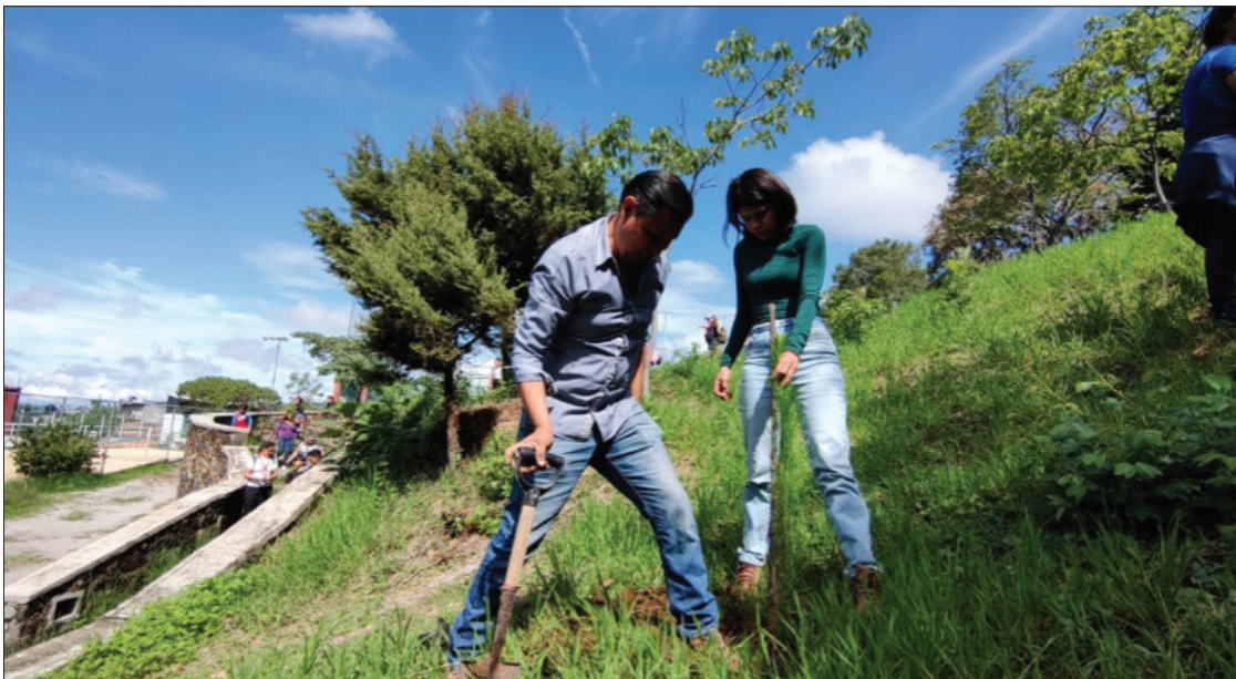
▲ La campaña se extenderá a todas las unidades de la UAEM en el estado.