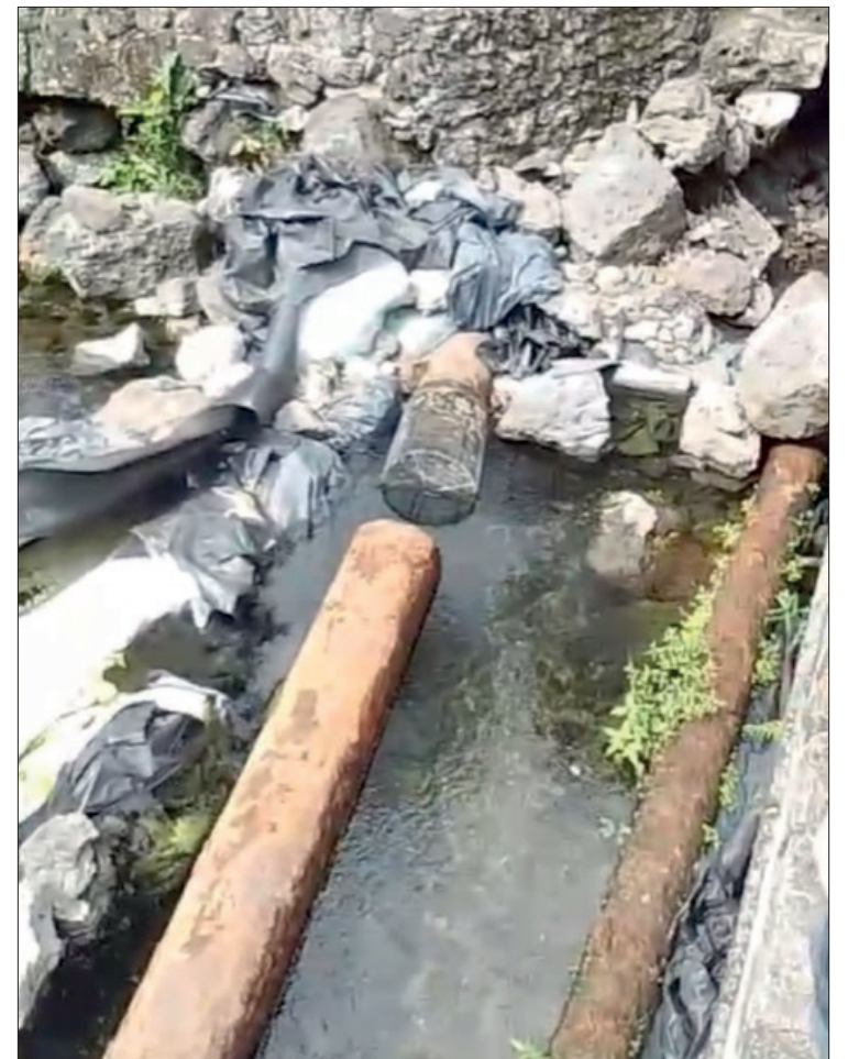
▲ Aunque no de forma total, el manantial que surte a comunidades de la zona sur de Morelos ha recuperado el nivel que le permite abreviar a los vecinos del área.