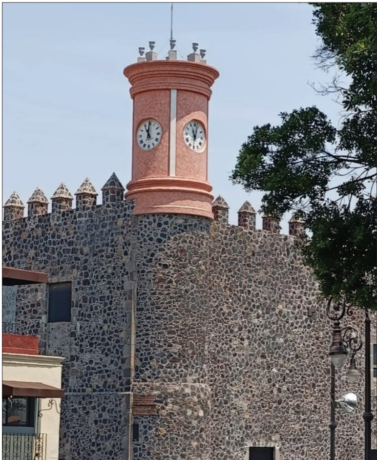
◀ El Palacio de Cortés está listo para recibir desde hoy el INAHFest, con que el Centro INAH Morelos celebra sus 50 años.

El INAHFest comienza este jueves, a partir de las 10:00 horas, cuando se realice la inauguración, hasta el mediodía del sábado con diversas actividades artístico-culturales para toda la familia. La entrada es gratuita.