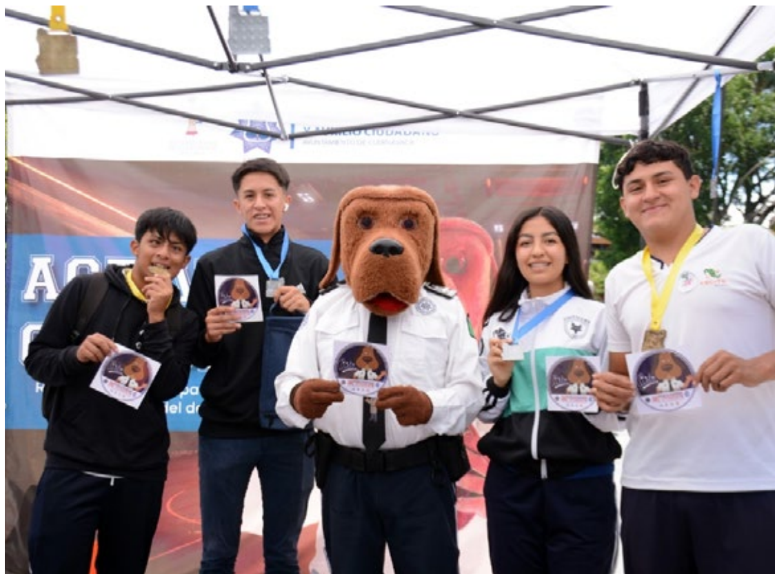
▲ El querido Beto, el Perro Guardián, de la policía de Cuernavaca volvió a sus labores de capacitación y formación de conciencia ciudadana entre la niñez y juventud de la ciudad.

También colaboraron el Instituto de la Juventud, así como las Direcciones de Atención a Grupos Vulnerables y de la Diversidad Sexual del Ayuntamiento de Cuernavaca.