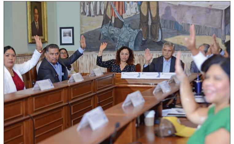
▲ El cabildo de la capital acordó que el apoyo se otorgará en dos aspectos: para el mejoramiento de sus instalaciones y como un apoyo a las familias que utilizan estos lugares de resguardo y cuidado de niñas y niños.