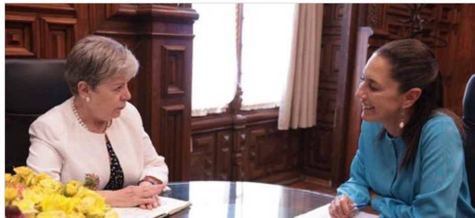
▲ Alicia Bárcena formará parte del gabinete de la presidenta electa de México, Claudia Sheinbaum, como secretaria de Medio Ambiente y Recursos Naturales (SEMARNAT).

Las acciones que los tomadores de decisiones realicen en el sexenio 2024-2030 serán fundamentales y ellas deberán estar respaldadas por una ciudadanía que comprenda la necesidad de la transición energética, de la del cambio de sus esquemas de movilidad por otros más sostenibles, de la importancia de la captación de agua pluvial y la reutilización de las aguas grises, así como de la producción de sus alimentos en huertos de traspatio e invernaderos, sean familiares o comunitarios.