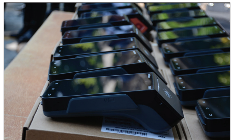
▲ Esta modalidad evita retirar placas y demás documentación al conductor que tendrá en automático un descuento del 50 por ciento por pago inmediato con tarjeta de débito o crédito. En la foto, los aparatos que portan los agentes viales.

A la fecha se han aplicado a través de este mecanismo cerca de ocho mil infracciones, reconociendo que la ciudadanía ha comenzado a acostumbrarse a utilizarlo como un mecanismo eficiente y eficaz que les evita dar varias vueltas y gastar recursos extras en la recuperación de sus documentos.