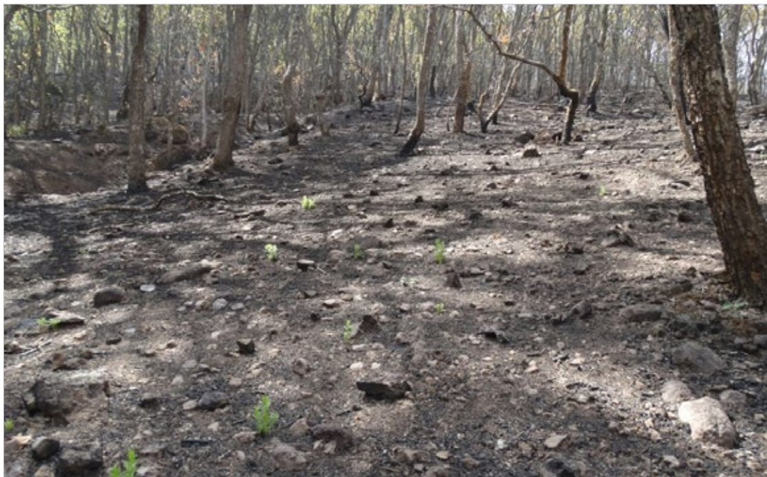
▲ Los resultados del fuego en la comunidad de El Zapote, en la Sierra de Huautla.

El curso taller se impartió durante tres días en los que se abordaron las principales acciones para prevención de incendios, como la realización de brechas