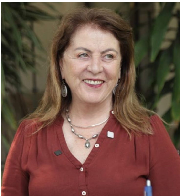
▲ Reconoció que, en materia de seguridad, se requerirá de un trabajo en equipo y buscará apoyarse con el Poder Legislativo para dotar de facultades y recursos necesarios a la nueva instancia encargada de la seguridad.

“Si queremos hacer una transformación de gobierno, tiene que ser completa en ese sentido” concluye sin dudar.