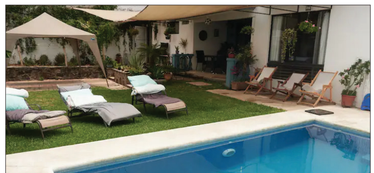
▲ Los fraudes con inmuebles van al alza, señalan.

cada vez es mayor, aunque también se han intensificado las campañas de difusión para rentar de forma segura y no ser víctimas de este delito, al recordar que Morelos es uno de los seis estados más buscados para invertir en bienes raíces.