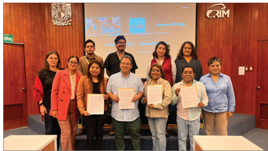
▲ Imagen: Cortesía de la autora.

Atendiendo al panorama anterior, resulta indispensable fortalecer los esfuerzos por impulsar alternativas como la ESS que recuperan el tejido social y permiten enfrentar