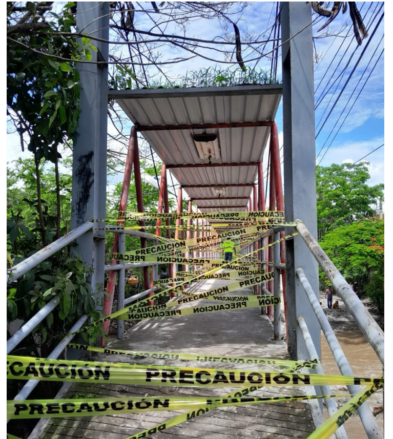
▲ Puente del Zopilote en Miacatlán.

En los municipios de Jojutla, Miacatlán y Puente de Ixtla, continúan emitiendo alerta a los vecinos que se ubican en zonas de riesgo, ya que el pronóstico del tiempo emitido por el Servicio Meteorológico Nacional y la Conagua, dan cuenta que continuarán las lluvias intensas que pueden provocar la creciente de ríos.