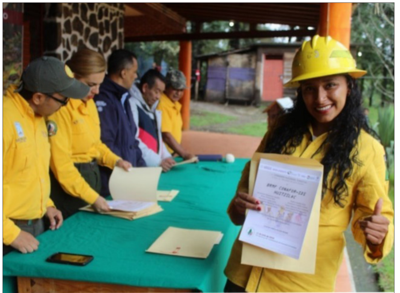
▲ La celebración fue el marco para entregar reconocimientos a los jefes y representantes de las distintas brigadas que atendieron los incendios forestales en el estado.

Después de la ceremonia, los combatientes y sus familias disfrutaron el parque, "echaron la cáscara" de futbol, y convivieron por varias horas para fortalecer lo que ellos mismos llaman a "hermandad de fuego".