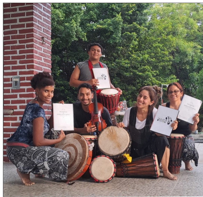
▲ El grupo Mulato Teatro

La autora señala que “las artes escénicas, representadas en ‘Simplemente ser’, juegan un rol crucial en la visibilización y empoderamiento de las raíces afro. Este evento no solo resalta la riqueza cultural de lxs afrodescendientes en México, sino que también ofrece un espacio donde las nuevas generaciones pueden reconocerse y sentirse representadas”.