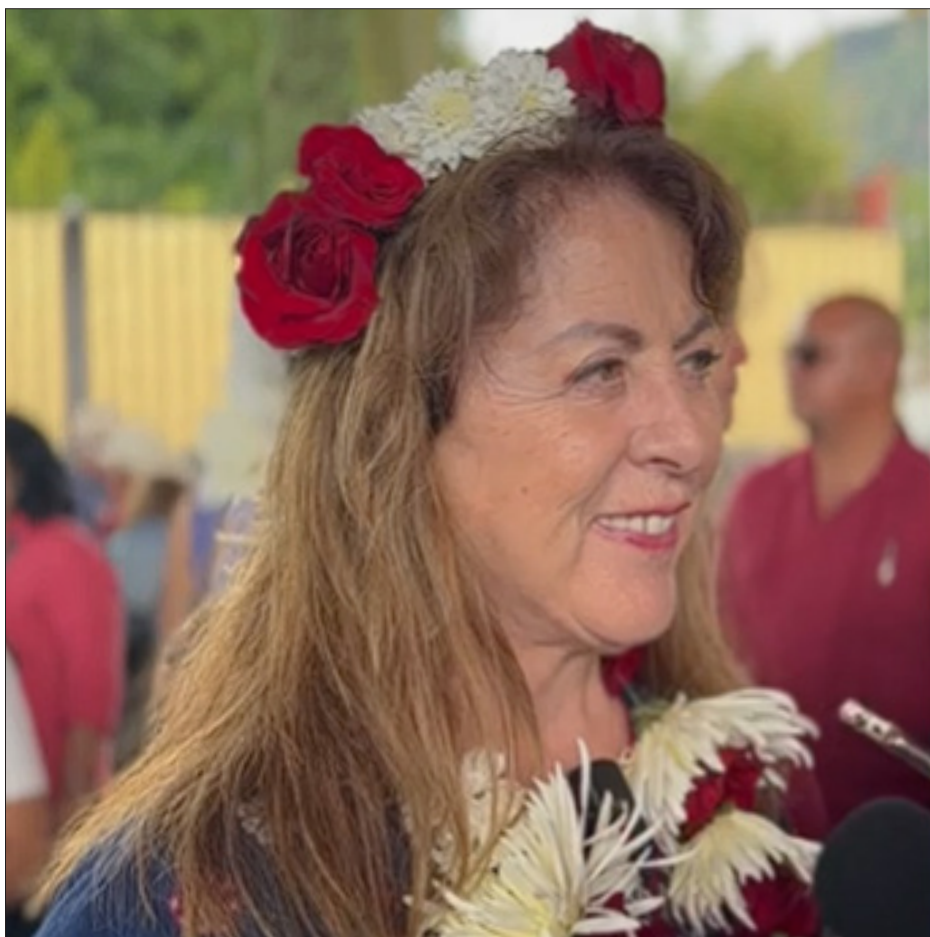
▲ La gobernadora electa adelantó que la próxima semana se reunirá con la presidenta electa, para estudiar los temas de Morelos; entre otros asuntos se revisarán la seguridad pública, los ocho proyectos prioritarios de su administración y la coordinación del Ejecutivo estatal con el gabinete federal.

Explicó que la coordinación es importante para concretar proyectos como el desarrollo habitacional del Puente Apatlaco, pues se ha reunido con el aún director del Instituto del Fondo Nacional para la Vivienda de los Trabajadores (Infonavit) y el presidente Andrés Manuel López Obrador anunció la próxima conclusión de una de sus fases en su conferencia de prensa “mañanera”; pero será necesario dar continuidad al resto de los temas con el nuevo funcionariado.