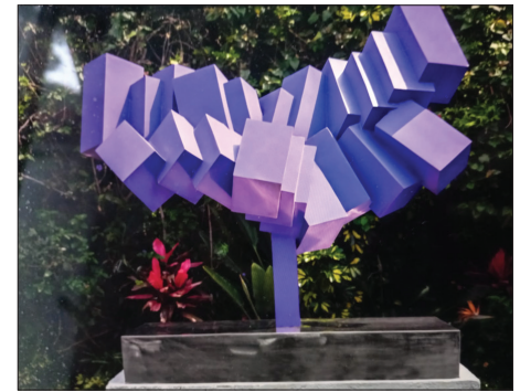
▲ Imagen: cortesía del autor

Los rojos, naranjas, verdes, ocre, guindas, fucsias en esos volúmenes tridimensionales, que recuerdan los bloques de sal, se convierten en una unidad indivisible, producida por otro binomio: el de un in-