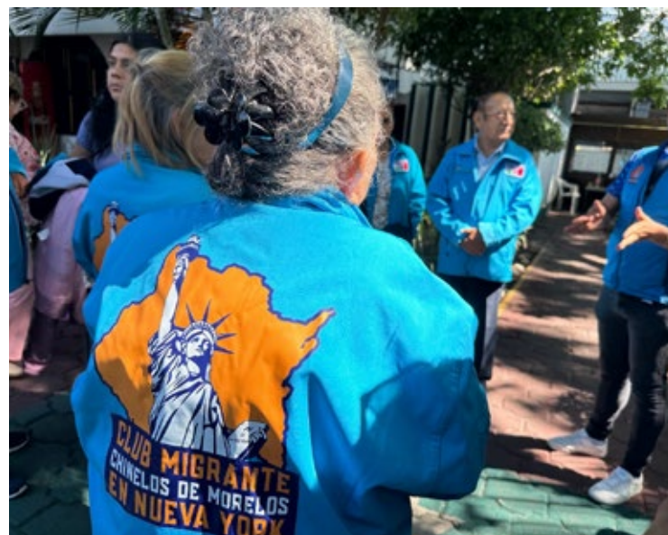
▲ “Club Migrante Chinelos de Morelos en Nueva York”, orienta a quienes buscan reunirse con sus familiares en Estados Unidos de todos los municipios, aunque operan en Zacatepec.