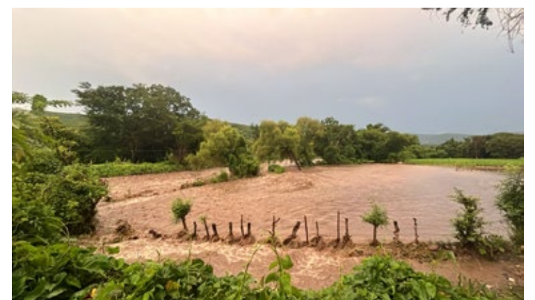
▲ El Chalma en los campos de cultivo de Mazatepec.