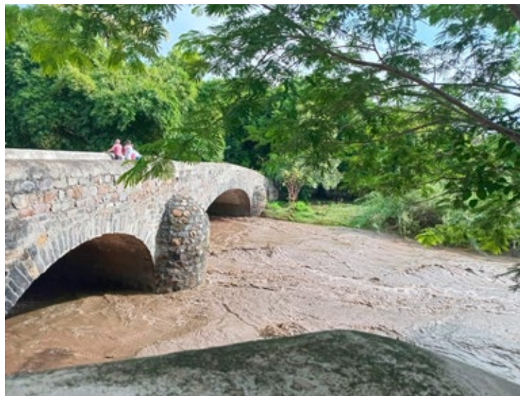
▲ El Castillo en Tetecala.