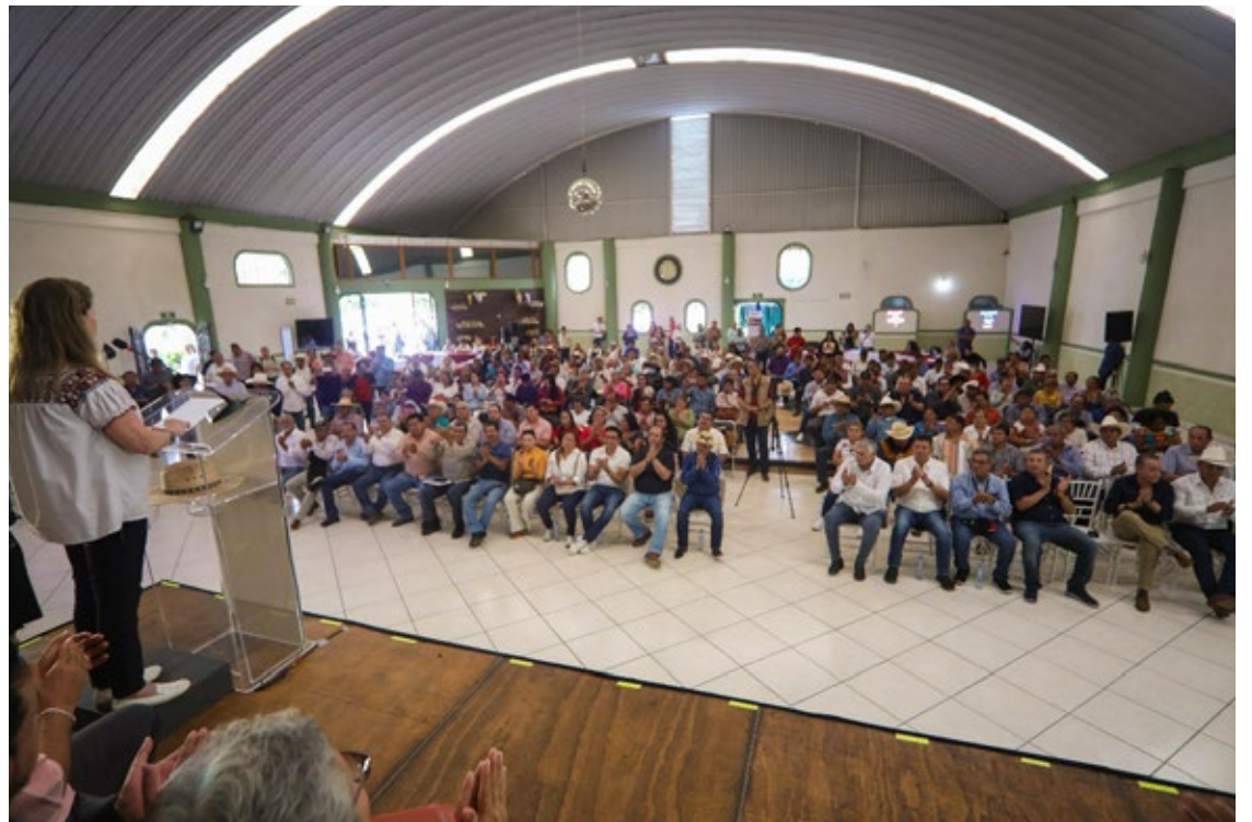
▲ Las siete regiones en las que se seccionará el campo morelense contarán con maquinaria y un plan hidroagrícola para impulsar su labor.

Cabe mencionar que Morelos es un estado principalmente rural, de las 487 mil hectáreas, 420 corresponden a este sector, es decir, el 86% del territorio está enfocado en esta labor, tiene posicionados entre los 10 primeros lugares de producción