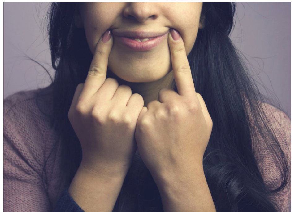
▲ Ilustración: Cortesía de la autora.

Hace más de 15 años tuve esa conversación y hoy, con la perspectiva del tiempo, sé que no era un delirio. En la vida, es fundamental escoger cuidadosamente a las personas que comparten nuestro espacio. Aquellas que están comprometidas con sanar sus heridas y que entienden que sus propios sentimientos no pueden ni deben invalidar los límites de los demás. Personas que han aprendido a respetar tu espacio y que han desarrollado la capacidad para entender tus sentimientos de manera auténtica y empática. Hoy, mi círculo cercano se ha reducido, pero es más sólido y genuino. Porque si no eres emocionalmente responsable, entonces, simplemente, no te quiero cerca.