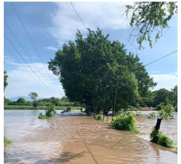
▲ Creciente del Chalma en Mazatepec.